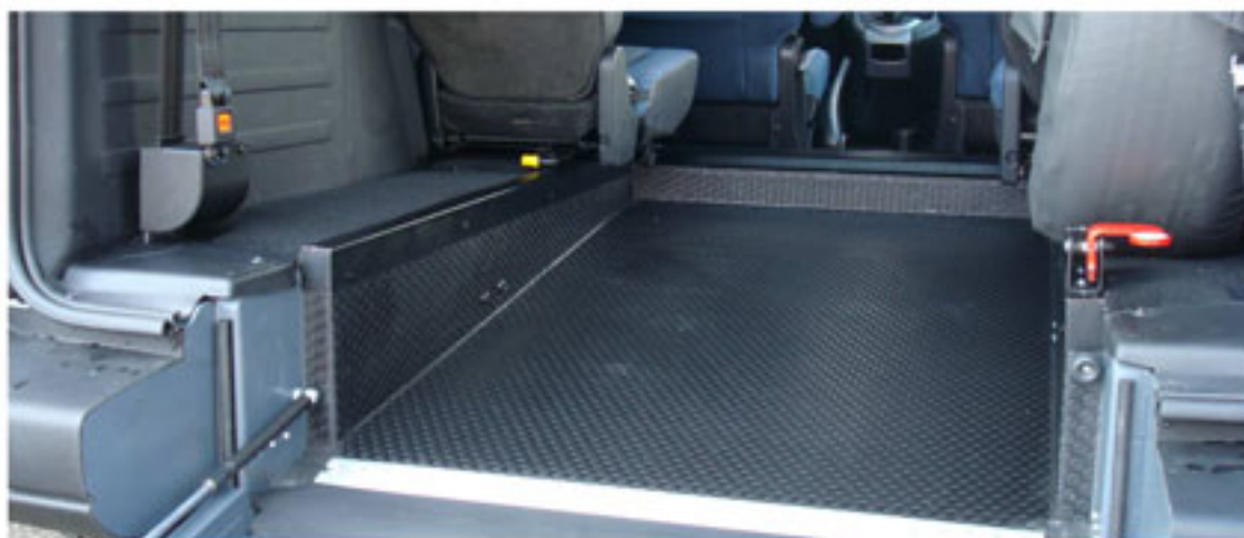
Divers types de fixation fauteuil