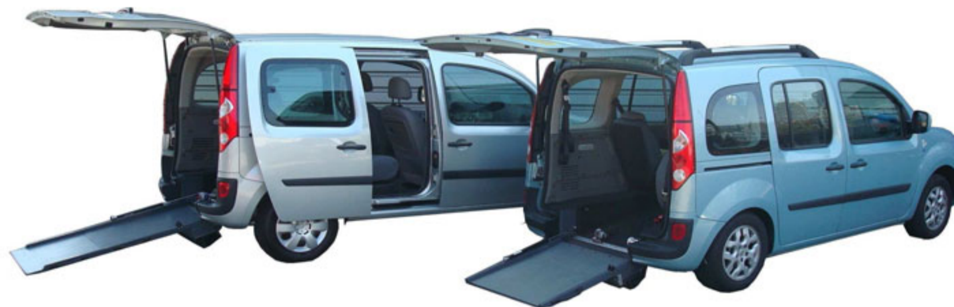
Portes AR battantes ou hayon, avec ou sans abaissement de suspension AR