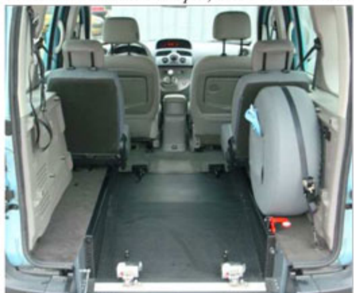
Divers types de fixation fauteuil roulant