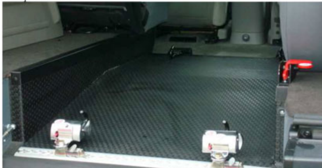
Décaissement ergonomique (sans ressaut ni rebords AV)