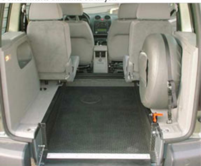
Divers types de fixation fauteuil roulant