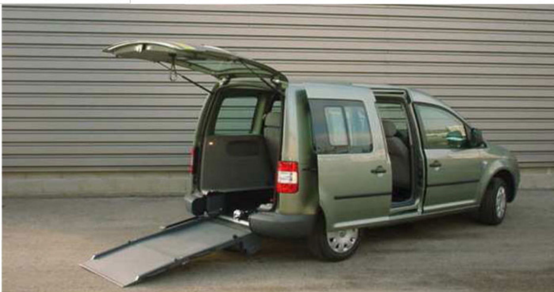
Portes arrières battantes ou hayon